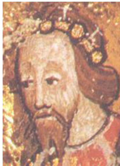
Édouard de Woodstock, dit "Le Prince Noir"

Le Prince Noir mourut de maladie en 1376, un an avant son père Édouard III. Il est enterré dans la Cathédrale de Cantorbéry en Angleterre où l'on peut encore admirer son magnifique et célèbre gisant.