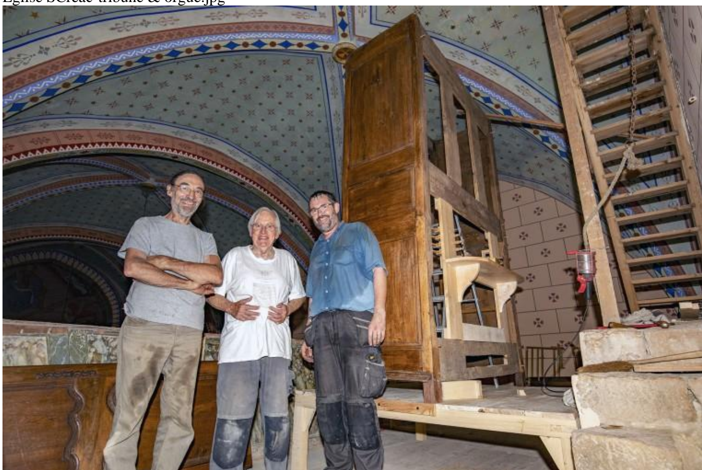
5695-installation orgue-11 aug2020.jpg