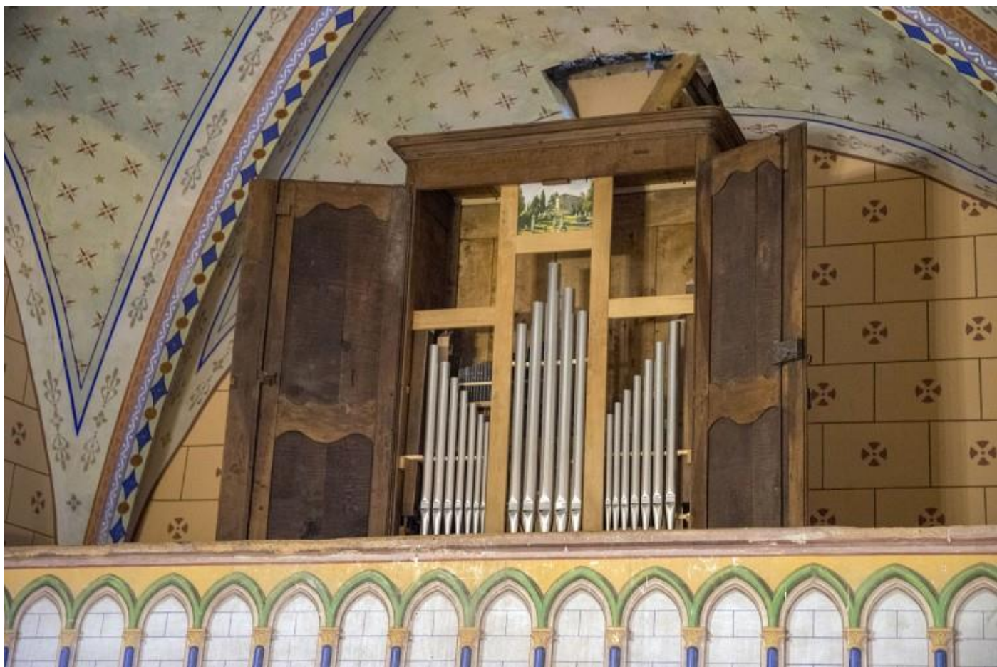
Eglise SCréac-tribune & orgue.jpg